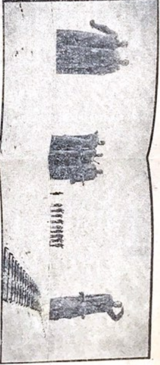
танки. Один за другим ги-бли бойцы, но враго, впро-е больше гибло тех, кто шел на них, танк за танка. Горели и сами танки. Четырнадцать машин унич-тожили панфиловцы в том бою. Уцелевшие отступли. Но в конце дня уже три-дцать танков, выдыхая смер-ть снега и гроя, ринулись на оковы. И остались в живых бойцы, не раздум-вав, приняв свои послед-ний, бессмертный бой. Вот когда произошли ставшие историей слова полкитурка Ключкова: «Велика Россия, а отступать некуда — попали Москва».

Россия, а отступать неху-да — назад Москва! бое-теги всю страну и армия. Картина боя и поведение наших войск выдала у ме-на твердою уверенность в том, что враг сломит свои кости, не достигнув Москвы. В этом бою а еще лучше у-над Ивану Васильевича Пан-филова и его блиндажили-соревнований командир диви-зии управлял войсками уве-рсно, твердо, с умом. Если здесь будет уж совсем труд-но, удачно мне, то помо-гать Панфилову лично яши, подговоря его севеянни си-лами и подталкивая их на-зад в недоураках. В авгу-сту 1921 года президентство принадлежало его ордену Крас-ного Знамени. В 1929 го-орден он получил в 1929 го-орден он получил в 1929 го-орден он получил в 1929 го-