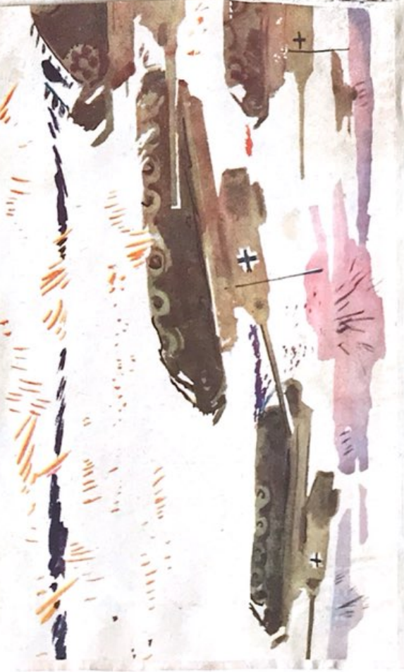
Рис. А. ИТКИНА