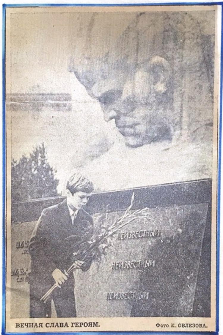
ВЕЧНАЯ СЛАВА ГЕРОЯМ.