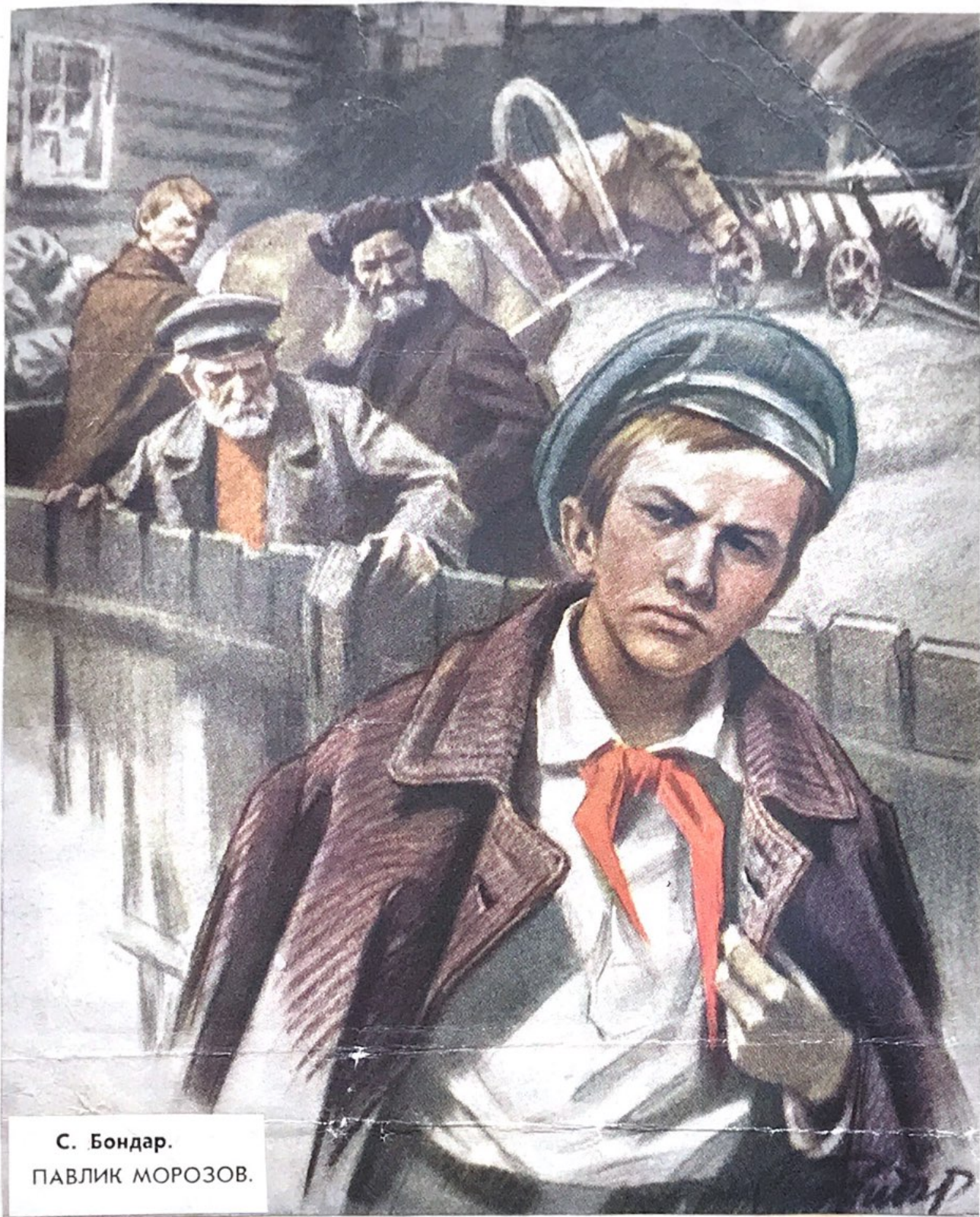
С. Бондар. ПАВЛИК МОРОЗОВ.