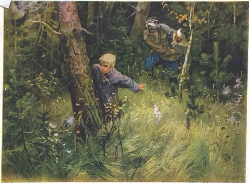
ПЕРВЫЙ ПОДВИГ Худ. Н. Обрыньба