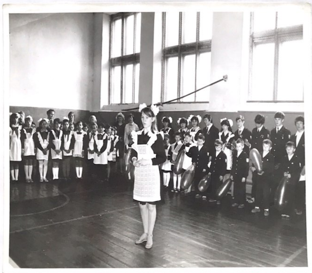
1 сентября ШВАБИРА 1984 год.