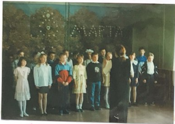
Праздник 8 марта