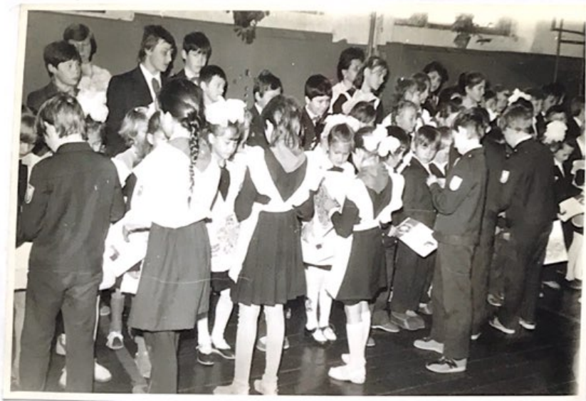
Приём в октябрят.