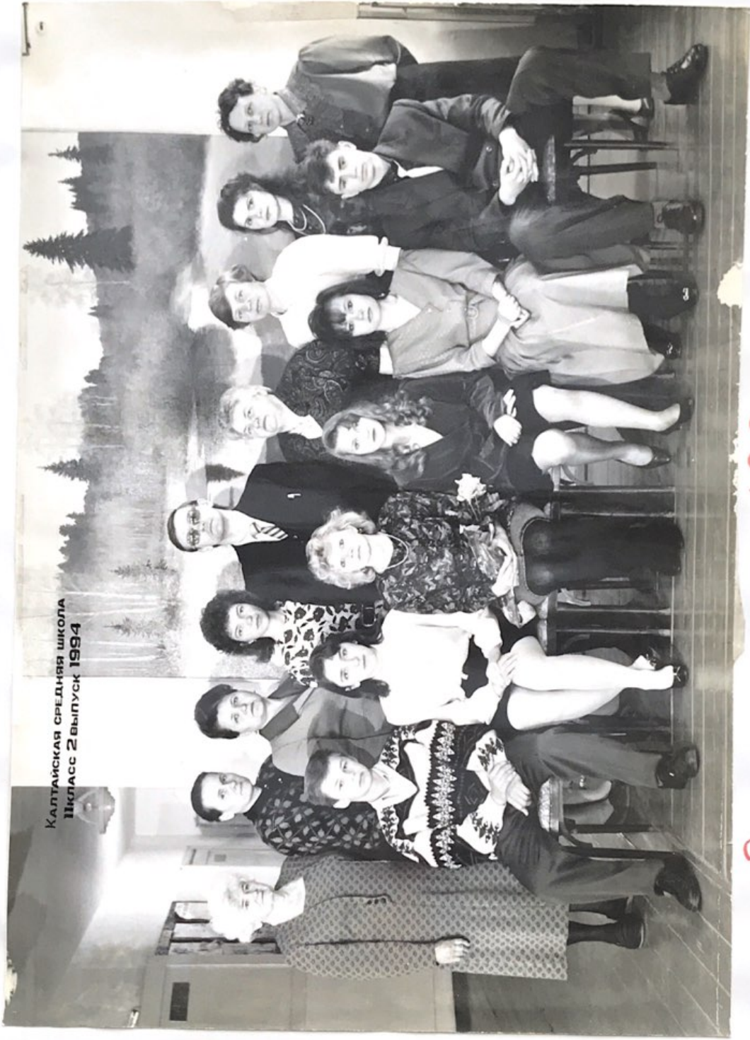
КАЛТАЙСКАЯ СРЕДНЯЯ ШКОЛА ШЛАСС 2 ВЫПУСК 1994