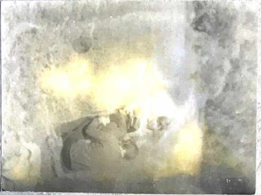
13 походе у Нямнока Шоми