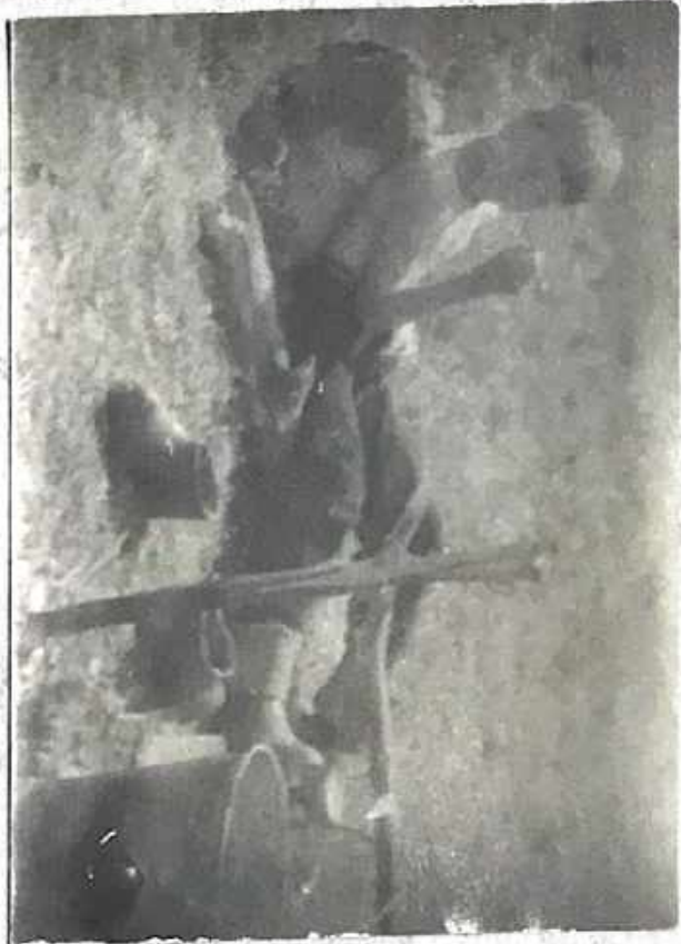
Тз похороде у тјумока Шиоми.