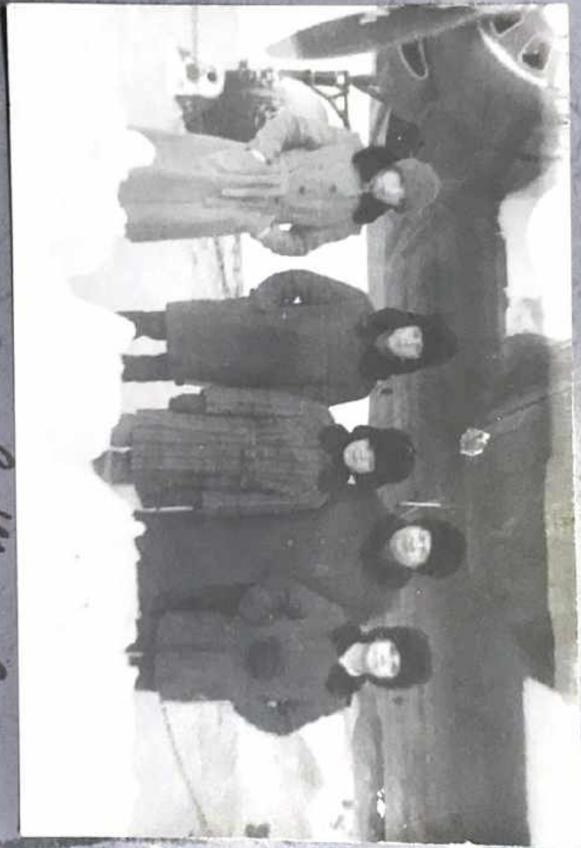
Denrypous & Thuer.