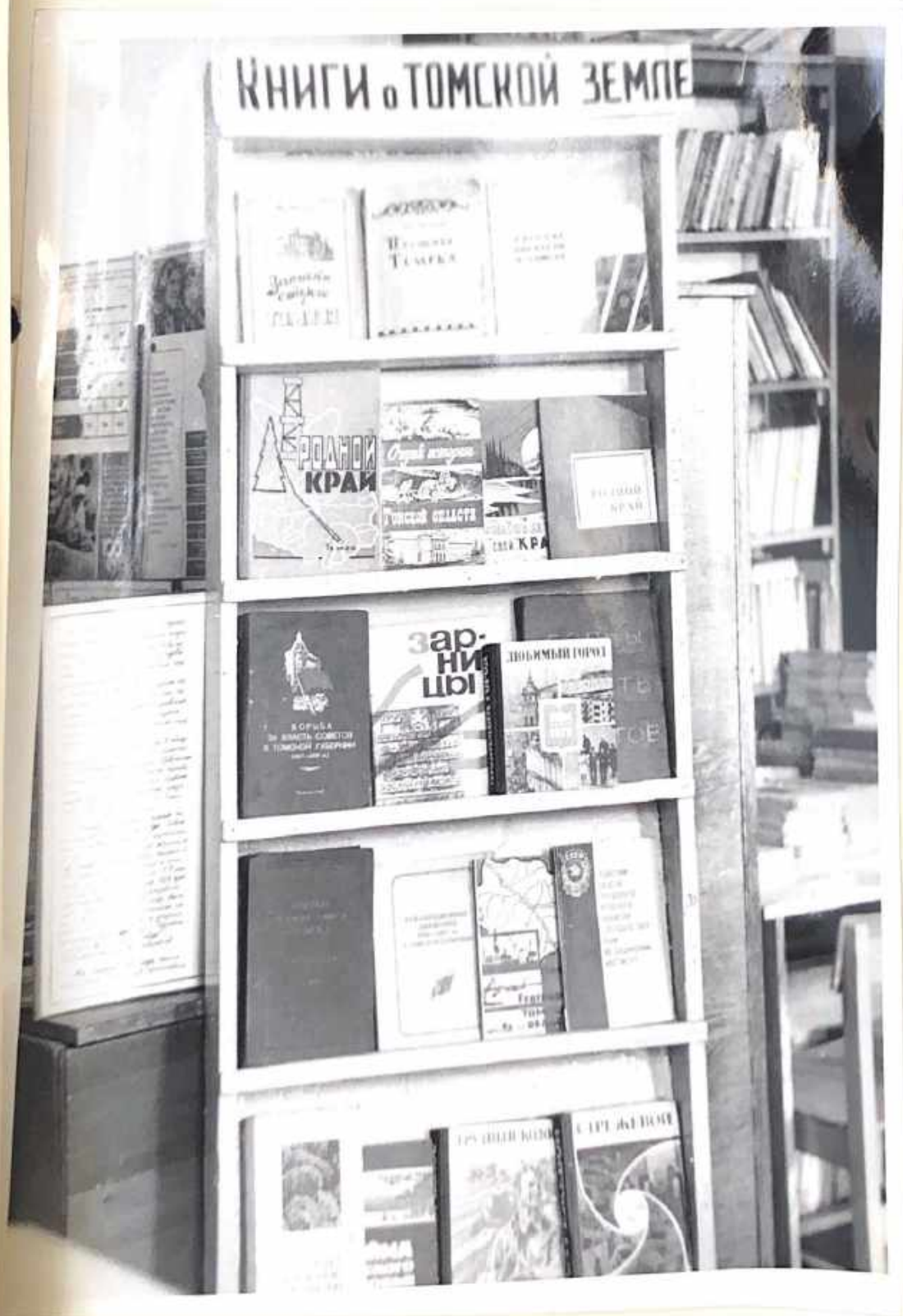
Выставка в библиотеке.