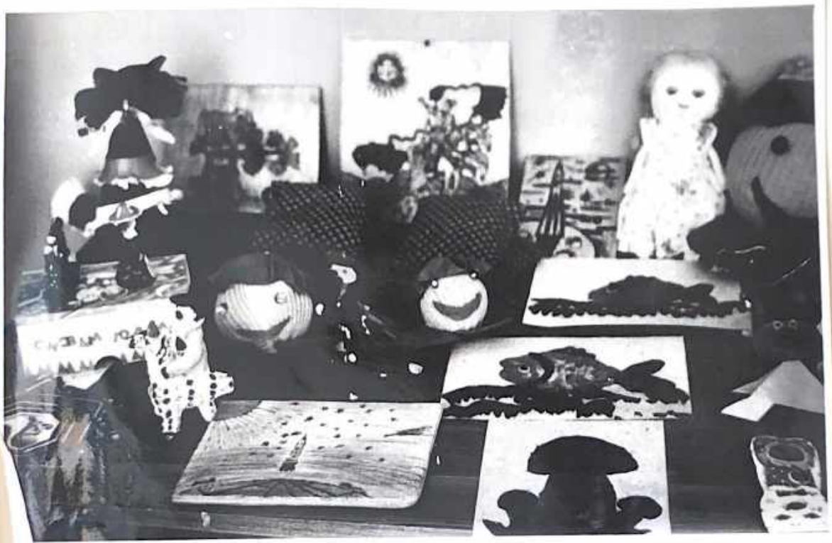
Выставка поделок учащихся.