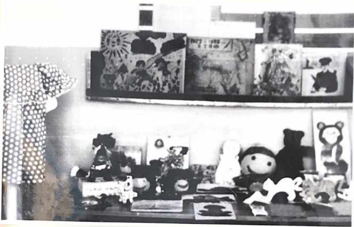
Выставка поделок учащихся