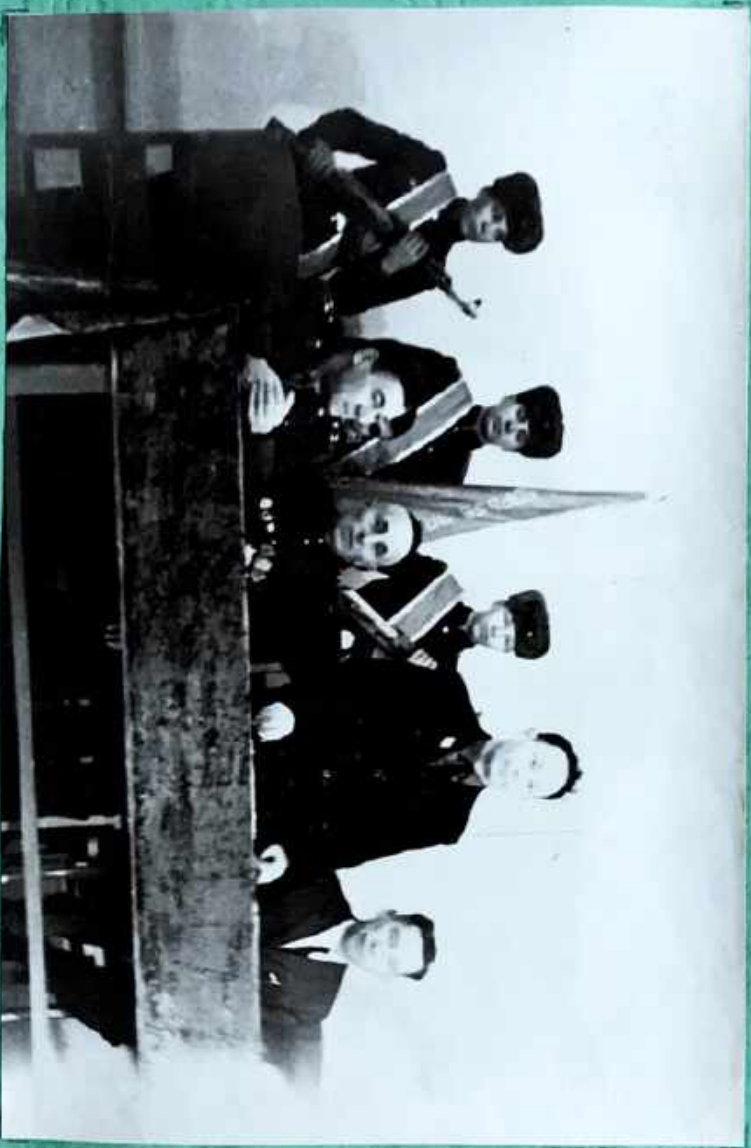
Бүгд эрхтнийнхний Хуралдаан Хөдөлгөөнд.