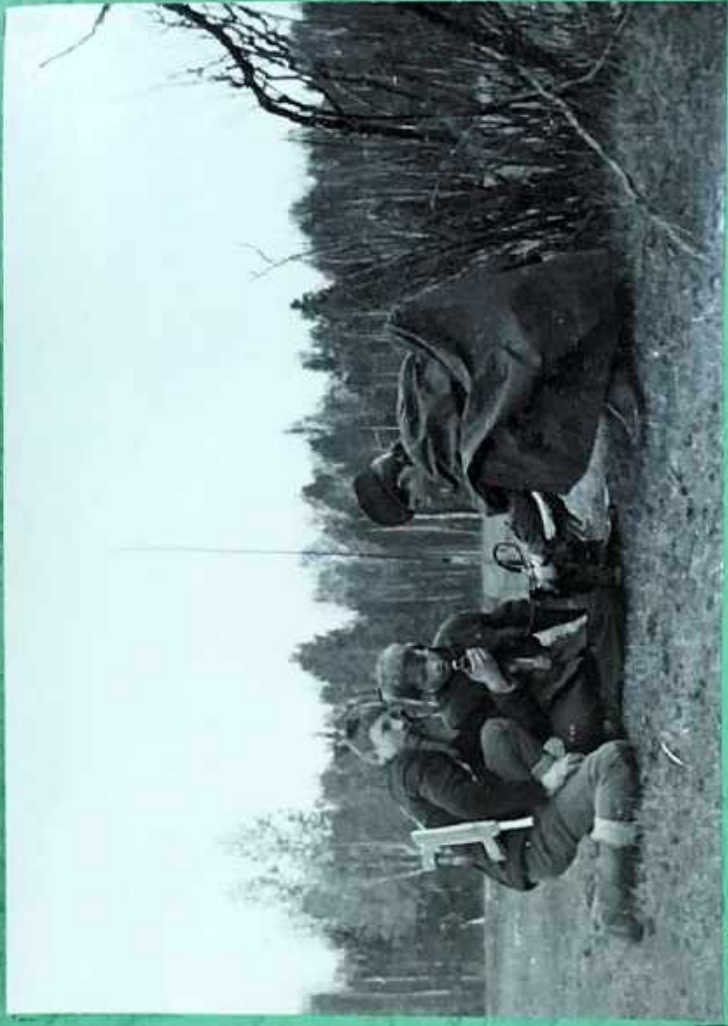
Группа работников на Д-105 не успела.