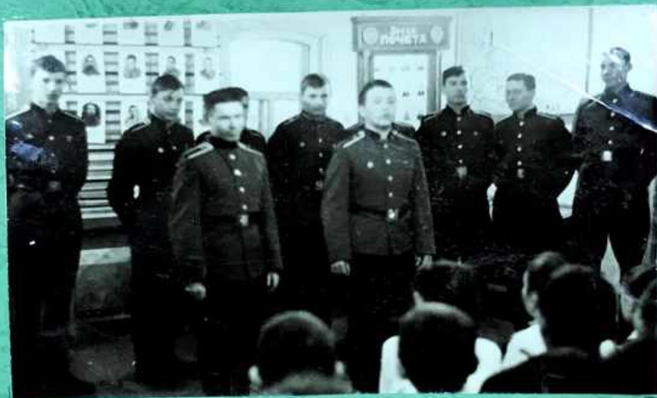
Шедры, курсанты ТМЦ, приехали с концертной программой.