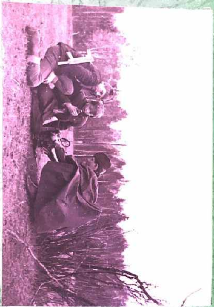
Myrmecol personnel near 9-105 Hyacinth.