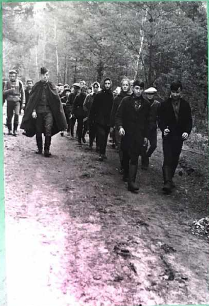
Подготовка к «Зарнице-4» Операция «Синий пакет»