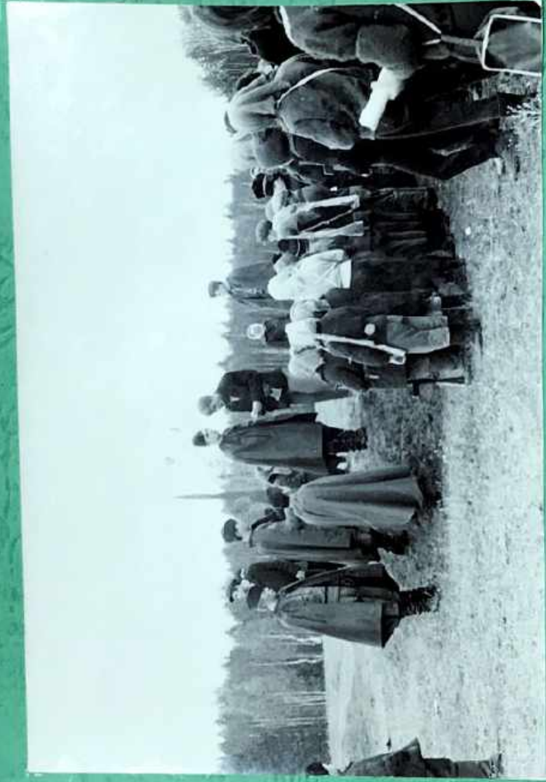
Tragbegegnung am 10. August 1914.