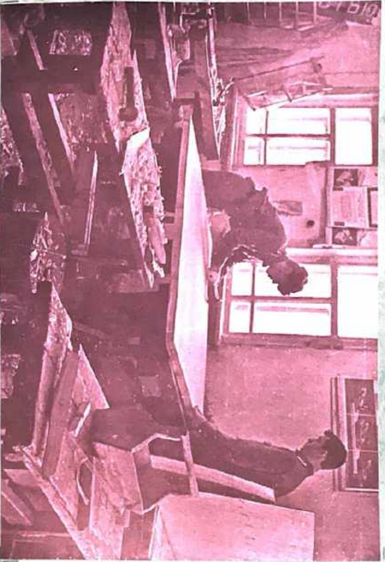
Shawu pupils & resources were inspected.