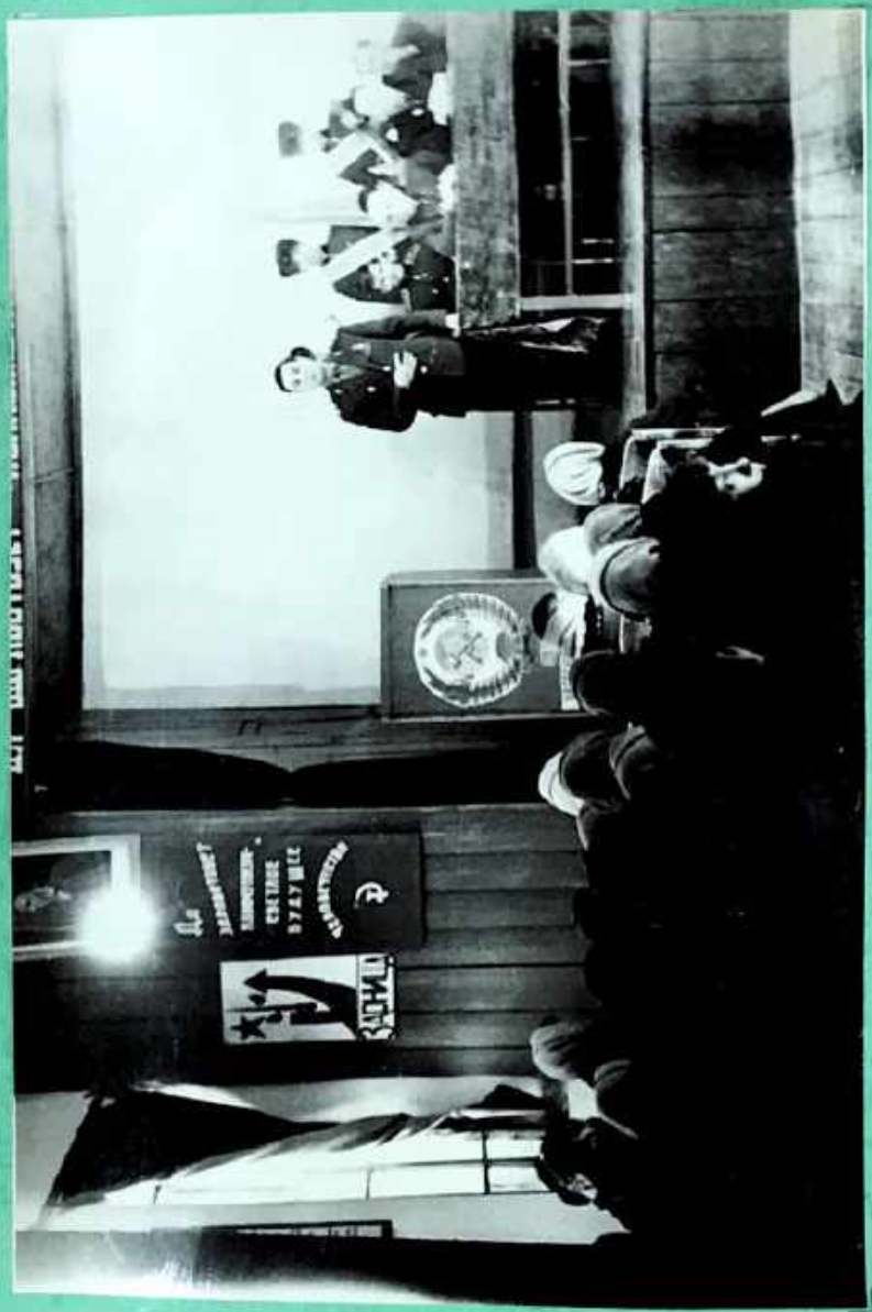
Историческое мероприятие в г. Самара