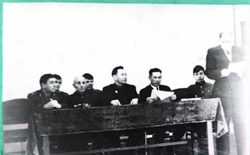
Батальонная группа от Дивизии Главного штаба «Зарница».