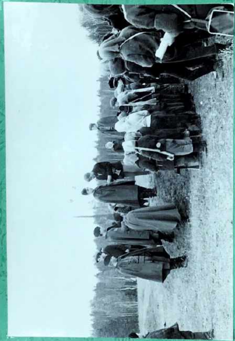
Тогтогмал хэмдэр бүлэгээр.