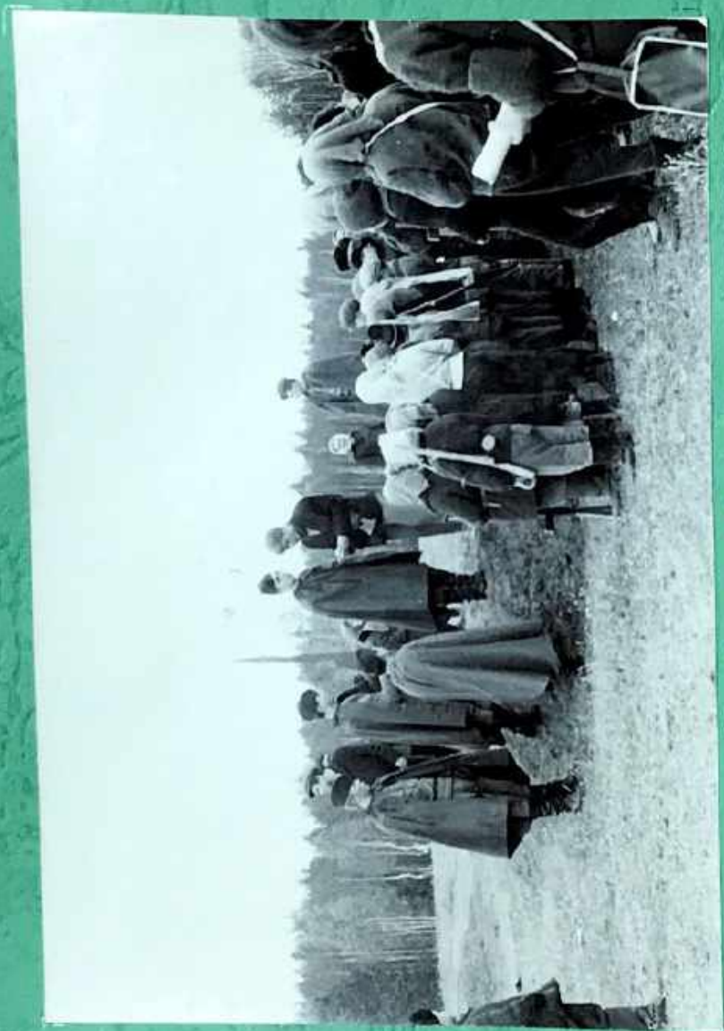
Tagalogman amores vikipasaya.