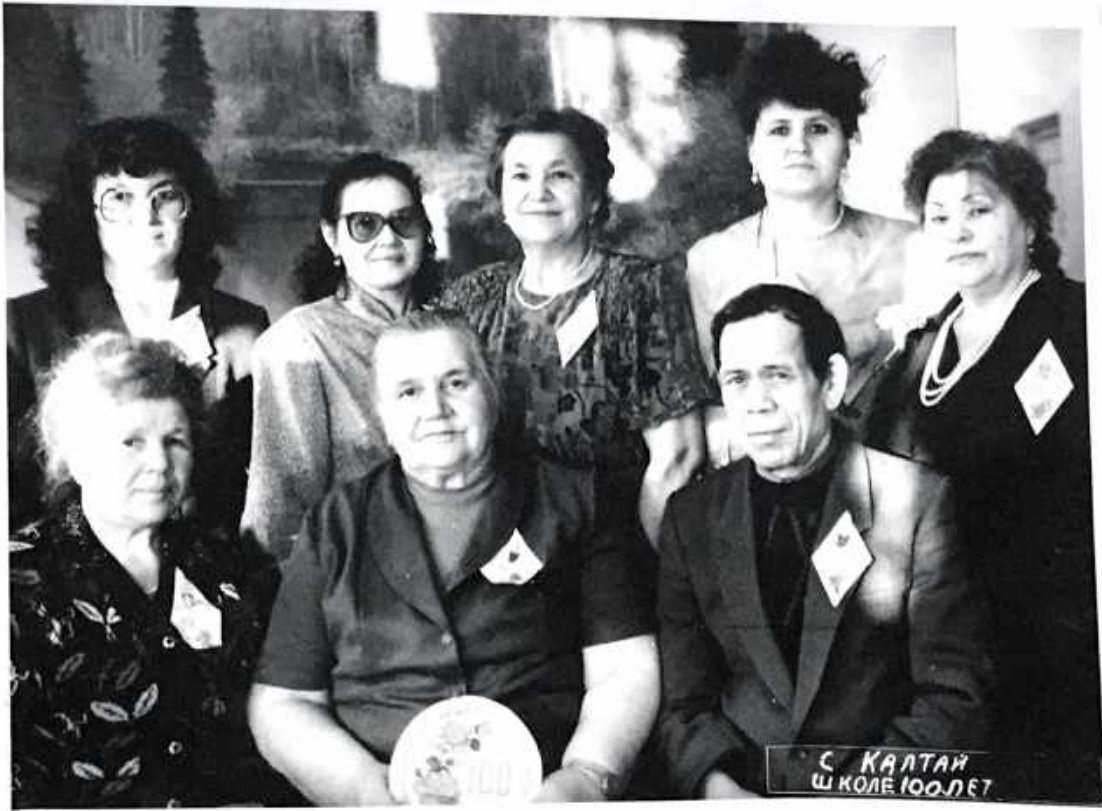
Выпускники 19 года.