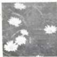
Подруги, пос. Молодежный, ср. школа.

Как нам жить сегодня на планете И забыть ослепнуть не хотим Пускай наша история с дня рождения И живем-мечтаем пожелания!