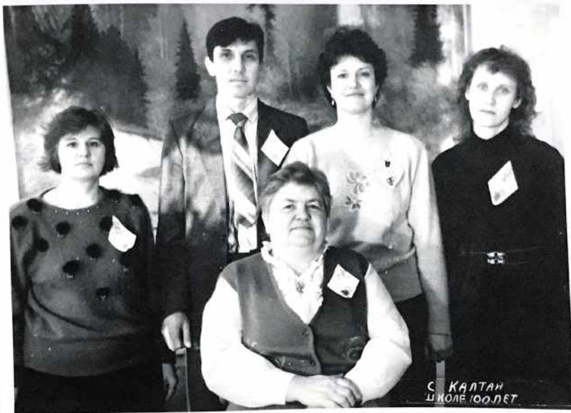
Выпускники 19 года