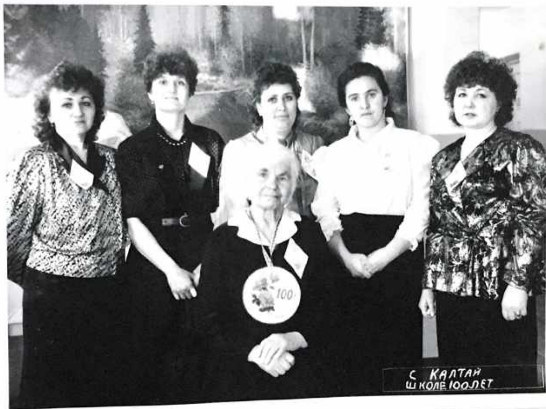
Выпускники 1974 года