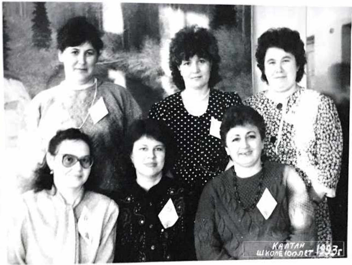
Выпускники 19 года