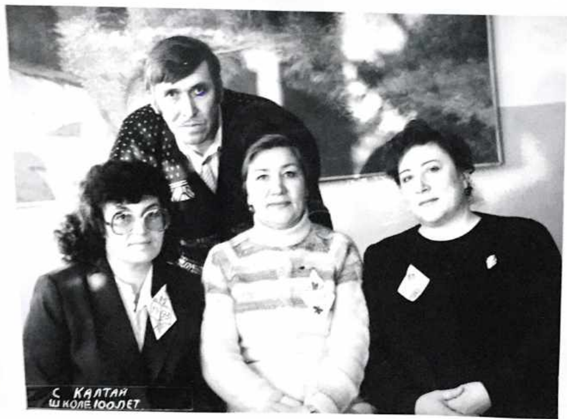
С КАЛТАН ШКОЛЕ 100 ЛЕТ.