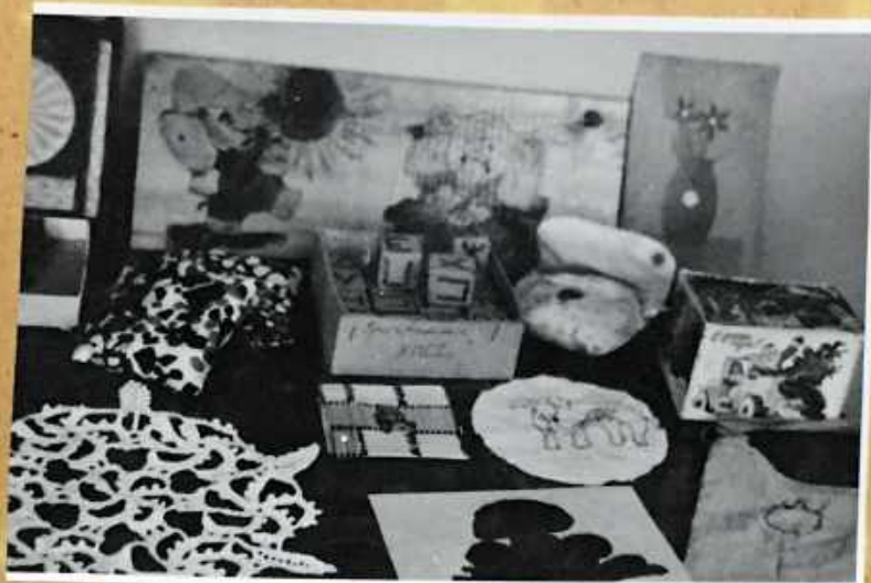
Выставка детских поделок.