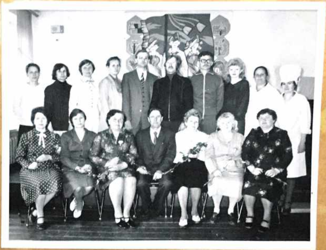
Комлектив учителей в 1984г.