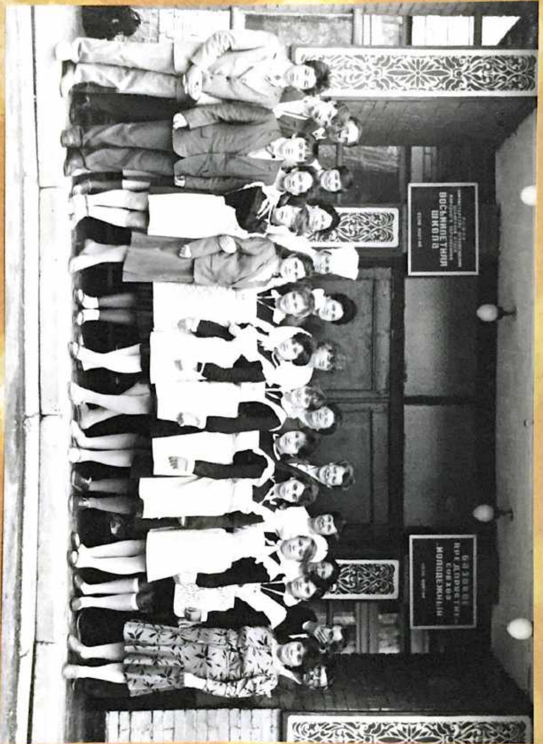
Парничка група 1988 гога и универзитетна група.